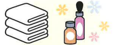
マッサージ・エステ など